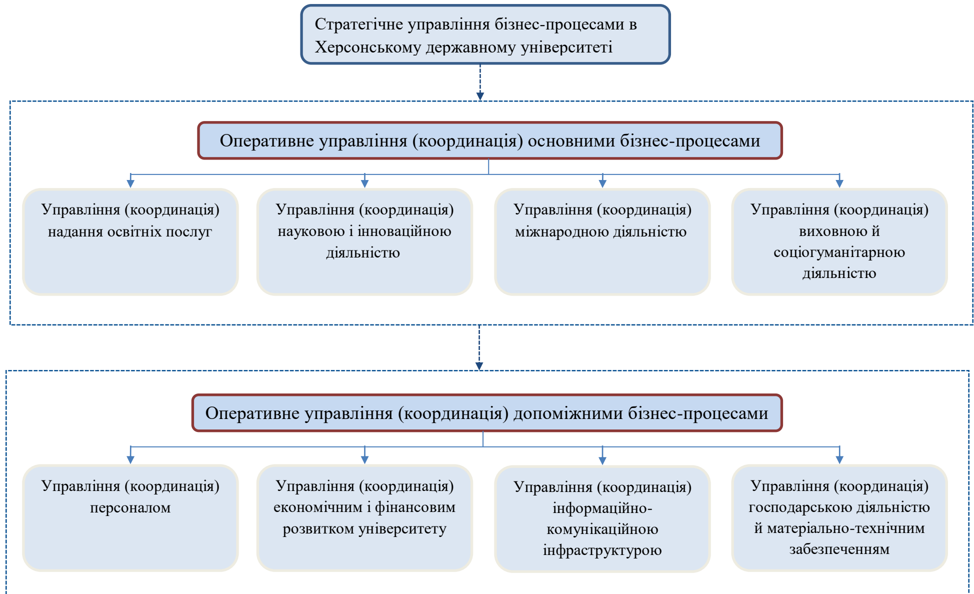
Рис. 2. Структура основних бізнес-процесів Херсонського державного університету